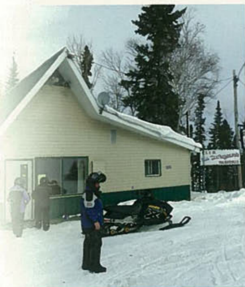
Relais de Palmarolle